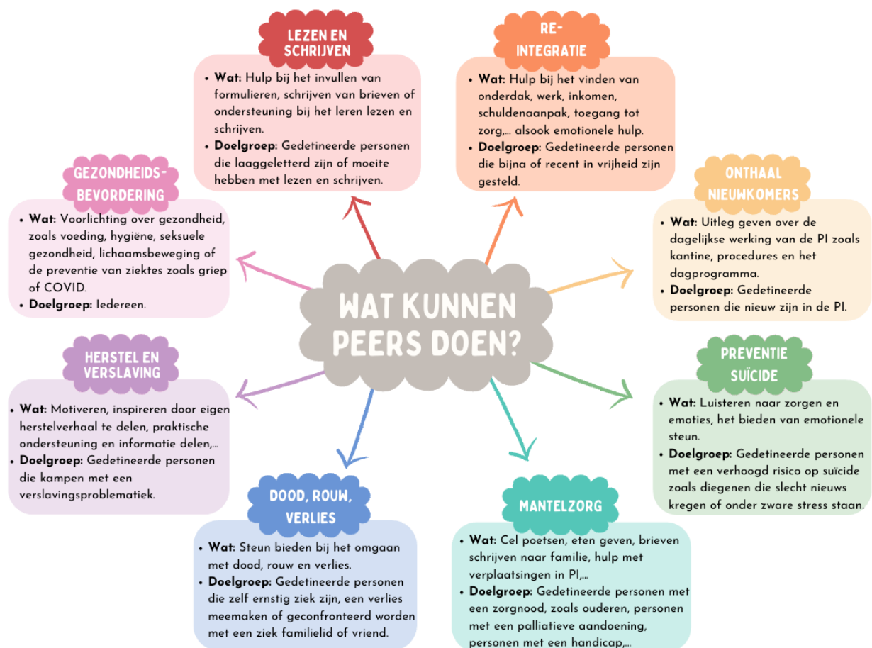
Figuur 1. Verschillende vormen van peer-to-peer zorg in penitentiaire inrichtingen over de hele wereld

Vraagt u zich af op welke manieren gedetineerde personen voor elkaar kunnen zorgen? Laat u inspireren door de voorbeelden uit figuur 1. Houd hierbij in het achterhoofd dat wat u vertelt tijdens het interview niet beperkt moet worden tot dergelijke voorbeelden. Integendeel, er zullen ongetwijfeld nog vele andere vormen van peer-to-peer zorg bestaan in de PI's.